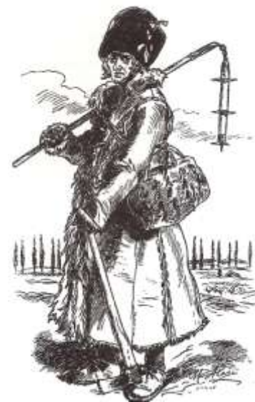
Selský rebel podle představ malíře Mikoláše Alše