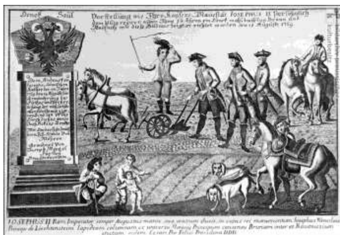
Josef II. jako „lidový císař“ oře na poli u Slavíkovice na Moravě

Sedláci v císaři viděli svého ochránce, ale současně je odrazovaly jeho pragmatické reformy, které např. zakazovaly procesy, či církevní svátky. S největším odporem se u poddaných setkala jeho nařízení týkající se posledních věcí člověka. Hřbitovy ve městech a obcích byly zrušeny, přesunuly se na městské předměstí, dále od obytných budov. Těla měla být uložena nejméně 48 hodin v nově budovaných márnících, aby se zabránilo pohřbení zdánlivě mrtvých lidí. Pohřbívání v dřevěných rakvích bylo zakázáno, z úsporných i hygienických důvodů měly být ostatky uloženy do hrobu pouze v lněných, případně papírových pytlicích, a měla být zasypaná vápnem a zeminou. Toto nařízení musel pro velký odpor obyvatelstva nakonec císař odvolat.