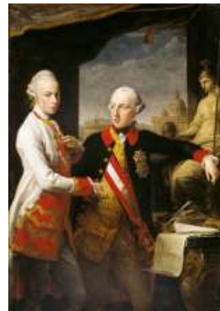
Josef II. s mladším bratrem a nástupcem Leopoldem II. (žil v letech 1747–1792)